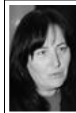
La scrittrice di Caselle Lurani seconda al concorso "Amico Rom" con il suo "La pianura dei misteri"

«Princkarang» in lingua romani significa «conosciamoci» e nessun'altra parola può rappresentare meglio il clima che si respirava il 15 novembre scorso sul palco del teatro Fedele Fenaroli, a Lanciano, la città in provincia di Chieti in cui si è svolta la cerimonia di premiazione del XV concorso artistico internazionale "Amico Rom", promosso dall'associazione Them Romanò e patrocinato dalla Presidenza della Repubblica italiana.