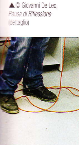
▲© Giovanni De Leo, Pausa di Riflessione (dettaglio)

► Un articolato percorso espositivo che riunisce oltre venti fotografie originali dedicate alla Grande Mela e realizzate, su pellicola, attraverso la tecnica della doppia esposizione o dell'esposizione multipla. Si