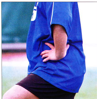
▲© Alberto Ianiro, Twentyone (dettaglio)

► Dalla mostra Last New York , foto di Davide Bramante.